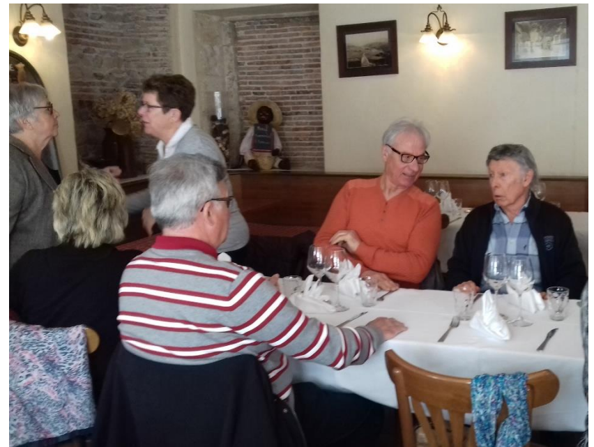
Et entament la conversation