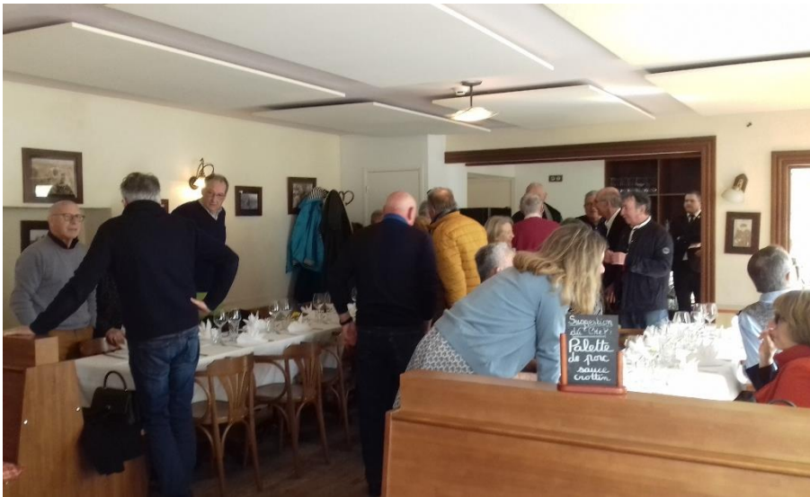
Les premiers arrivés s'installent autour des tables